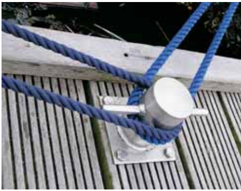
Er kunnen veel meer lijnen om een steigerbolder als deze teruggevoerd worden naar het eigen schip.

omheen (doorheen) zou willen hebben. Je kunt dat nog toelichten met een beleefd verzoek, zonodig gevolgd door de Duitse, Franse of Engelse vertaling. Maar zo zorg je dat de lijn komt waar jij hem hebben wilt. Als de lus op de juiste paal op de wal is kun je met de lijn aan boord zelf bepalen op welk moment en op welke lengte je deze vastzet. Als je graag een dubbele lijn wilt, kun je deze later altijd nog zetten.