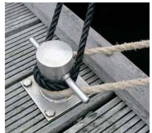
Een dubbele lijn kun je heel eenvoudig onder de eerste lijn op de steigerbolder leggen.