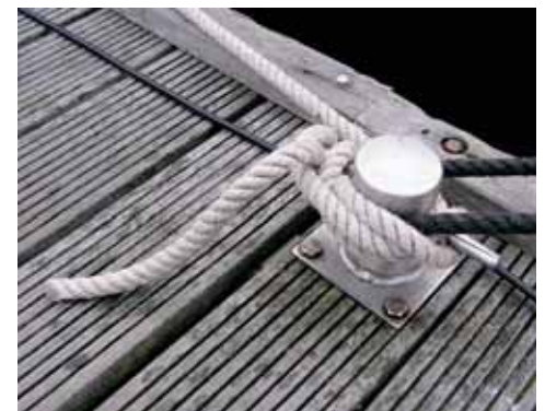
Het beleggen van een lijn op de steiger houdt soms ook in dat het voor de buurman moeilijk wordt om te vertrekken. Ook om die reden is het handiger om alleen een lus of een dubbele lijn aan wal te hebben en de lijn aan boord te beleggen.

of vraag je de havenmeester om te helpen. Dat kan heel nuttig zijn als er veel wind staat. Nog beter is het als iedereen bij zijn lijnen kan, want dat is ook mogelijk.