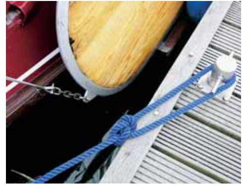
Foto boven, links en onder: Beleg de lijn bij voorkeur op je eigen schip. Je hebt de lijn bij de hand en er blijft ruimte op de steigerboldertjes voor meerdere lijnen.